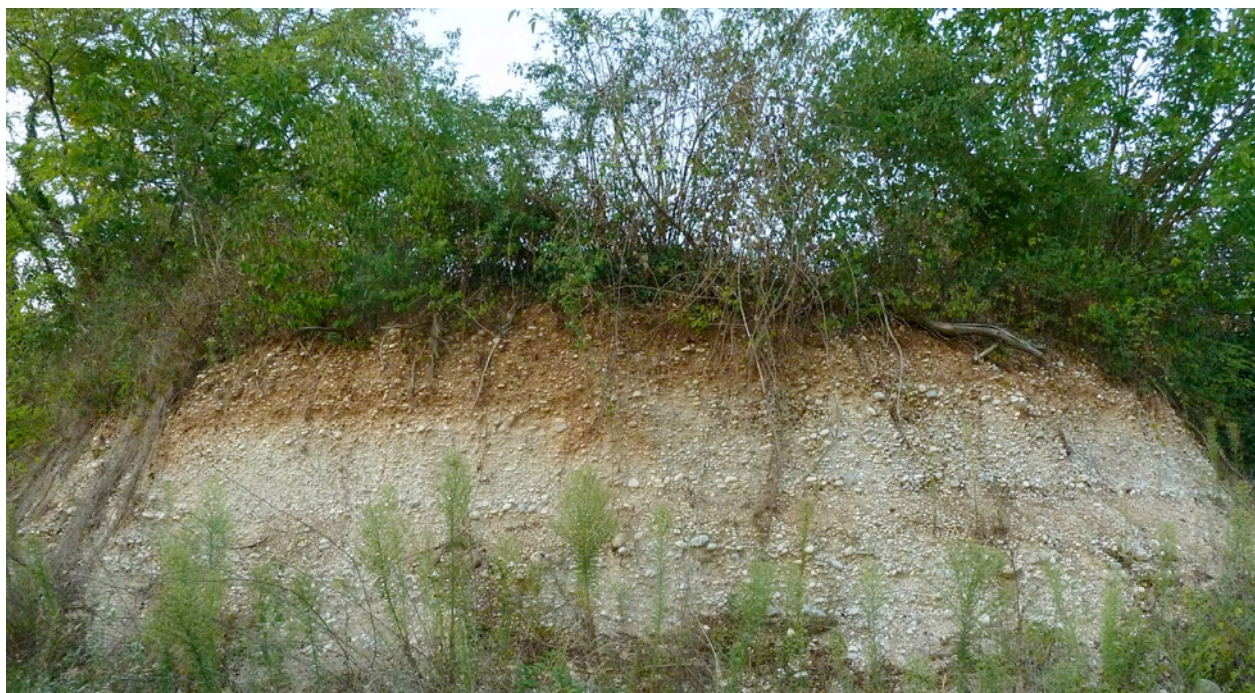
Profilo di un terreno esposto a seguito di uno sbancamento - Corno di Rosazzo (UD)

Se fossimo dei pittori e ne dovessimo realizzare un quadro, probabilmente ci accorgeremmo che le immagini mentali che ne abbiamo sono tutte a due dimensioni (1) , non sufficienti per un risultato soddisfacente. Come aggiungere prospettiva al nostro quadro? Cercandola sotto la superficie del terreno.