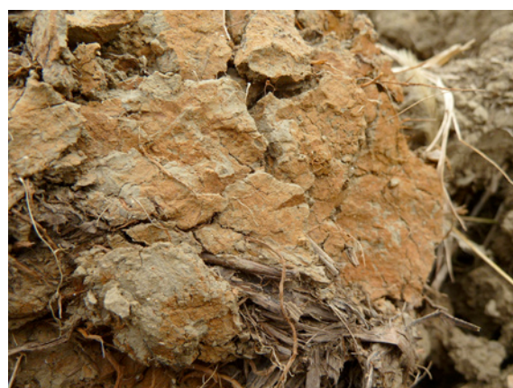
Fig. 7. Dettaglio della zolla

In definitiva possiamo dire che ciò che caratterizza maggiormente questo terreno è la sua scarsa aerazione, condizione che limita la produzione delle colture in misura maggiore rispetto alle pratiche colturali adottate nel breve termine.