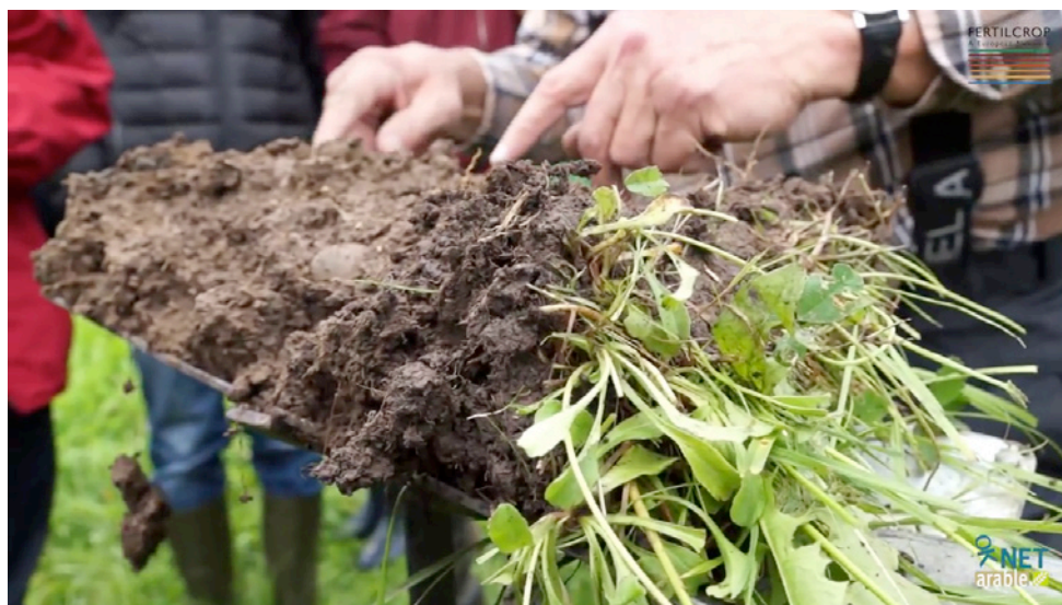
Fig. 11. Osservazione di una zolla di terreno estratta con una vanga.

Abbiamo bisogno di strumenti particolari per effettuare queste osservazioni? La dotazione minima è rappresentata da una vanga (9) . Con la vanga possiamo realizzare dei “mini” profili che, a differenza dei profili descritti in precedenza, vengono interpretati non osservando la parete della fossa, ma osservando la fetta di terreno estratta (fig. 11). In questo modo possiamo realizzare un numero maggiore di osservazioni a parità di tempo impiegato.