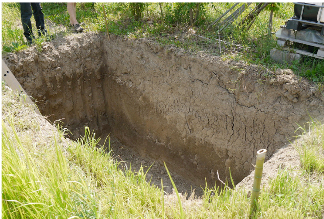
Fig. 8. Trincea pedologica

In questa azienda il terreno era decisamente diverso e la fossa pedologica aperta (fig. 8) ha evidenziato altre caratteristiche. L'esame visivo del colore ha permesso di rilevare che non vi era un elevato contenuto di sostanza organica, la tessitura era meno "pesante" per la ridotta percentuale di argilla ma vi era probabilmente un buon quantitativo di limo. Facendo scorrere tra le dita una zolletta di terreno, dopo averla inumidita con dell'acqua, la sensazione al tatto era sia di ruvidità, dovuta alla presenza di sabbia (la sabbia è la frazione più grossolana tra i componenti della terra fine), sia di "saponosità" dovuta al limo. Anche qui la struttura del terreno non era ottimale in quanto "carente" di pori, anche se non vi erano sintomi visivi di asfissia come per il profilo precedente. Il colore del terreno non si differenziava molto scendendo verso il basso se non a causa dell'umidità. Riassumendo possiamo dire che questo terreno presenta un profilo "giovane", che non si è ancora evoluto verso una maggiore complessità, probabilmente anche a causa di eventi relativamente recenti che ne hanno disturbato la stratigrafia. Mentre il terreno precedente non trarrebbe grossi vantaggi da apporti di sostanza organica, già presente in buone quantità ma poco evoluta, qui se ne avrebbero sicuramente dei benefici; dei sovesci di piante con radici fittonanti, alternati a graminacee come il sudangrass, potrebbero aiutare a ristrutturare il terreno in tempi non molto lunghi.