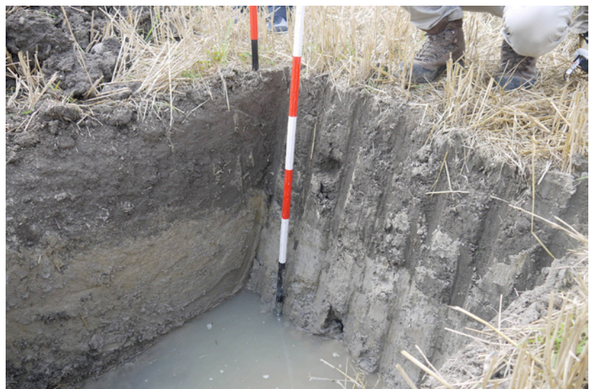
Fig. 3. Dettaglio trincea