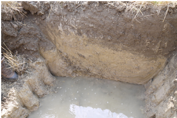
Fig. 4. Dettaglio orizzonti pedologici