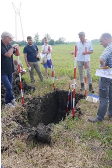
Fig. 2. Trincea (fossa) pedologica

A Vistorta sono state realizzate due fosse per visionare il profilo del terreno, una in un seminativo e l'altra in un vigneto. Il seminativo (figg. 2, 3 e 4) era stato precedentemente coltivato a frumento e la raccolta effettuata una decina di giorni prima. Il risultato produttivo, in linea con le annate precedenti, era risultato non completamente soddisfacente (circa 2,5 t/ha); anche le diverse prove di concimazione effettuate (in presemina e in copertura), non si sono differenziate significativamente per livello produttivo.