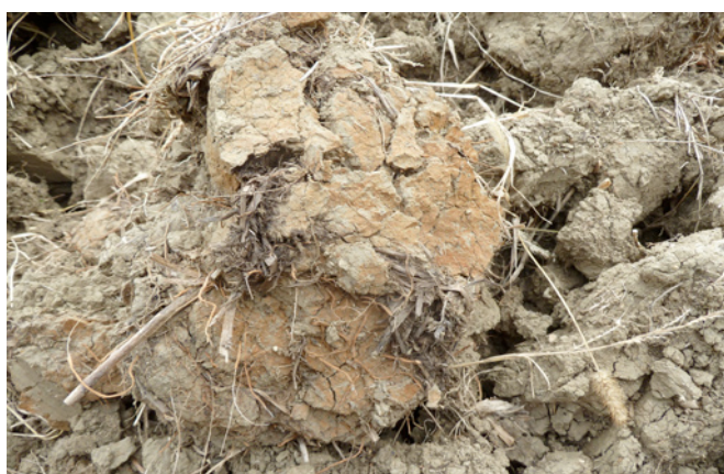
Fig. 6. Zolla con colorazione dovuta a fenomeni di riduzione - ossidazione a carico del ferro

Oltre a queste osservazioni ve ne sono numerose altre che si possono effettuare, come l’eventuale presenza di strati compattati, ad esempio le famose suole di lavorazione (7) , la presenza e distribuzione lungo il profilo degli apparati radicali e la numerosità dei lombrichi presenti.