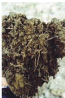
PLATE 3 How to score soil porosity

Esiste una guida, un vademecum, che ci indirizzi nell'osservazione dei nostri terreni se non abbiamo a nostra disposizione un geologo? Una possibilità è data da una tecnica, definita valutazione visiva del terreno (VSA) (ne è l'acronimo inglese), che è basata sulla valutazione visiva di alcuni parametri ( indicatori ) macroscopici del terreno e delle piante che vi crescono (ad esempio: colore, porosità, struttura, fauna, apparati radicali, ...). Questa valutazione visiva porta all'assegnazione di un punteggio (0=scarso, 1=discreto, 2=buono) per ogni indicatore preso in esame, ogni singolo valore attribuito viene poi "pesato" tramite un coefficiente in funzione dell'importanza dell'indicatore associato. Per quanto riguarda la porosità ad esempio, si confronta la porosità di una zolla di terreno con le foto della fig. 9. Per la zolla delle figure 6 e 7 il giudizio sarebbe compreso tra 0 e 1.