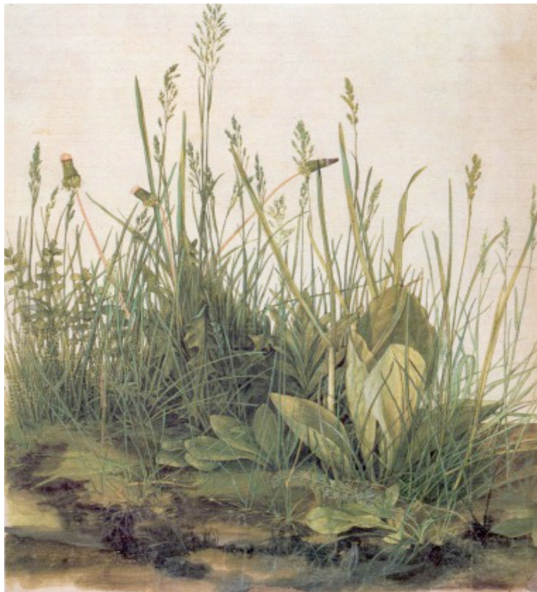
Albrecht Dürer - La grande zolla (1503) - Wikipedia

Il terreno è un sistema vivo composto da numerosissime parti, tutte queste interagiscono tra di loro per offrirci un ambiente idoneo alla coltivazione, se una parte non si esprime al meglio, ne risente tutto il sistema. Come accorgerci se una parte “non sta bene”, o se la conduzione a cui costringiamo il terreno è salutare? La pedologia, scienza che studia i terreni, è sicuramente una materia complessa e specialistica, ma alcune delle sue basi sono alla portata di tutti noi. Partendo dalle informazioni sullo stato fisico del terreno (colore, tessitura, porosità, ...) e associandovi quelle relative alla biodiversità possiamo farci una idea reale sullo stato di salute dei nostri terreni. A questo punto dovremmo avere tutti gli elementi per dipingere il quadro del nostro terreno, il nostro quadro.