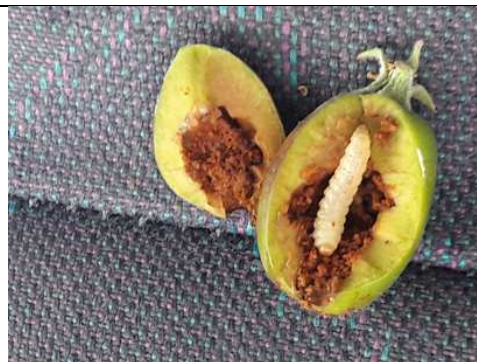
Foto 2- Foro di penetrazione di tentredine